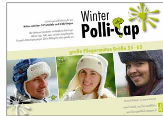
Große Winter Polli-Cap Fliegermütze • Größe 53 - 63