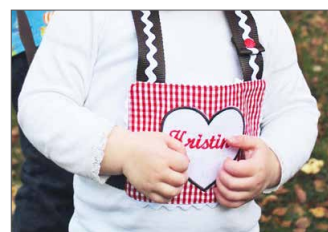
Pferdeleine zum Pferdchen Spielen