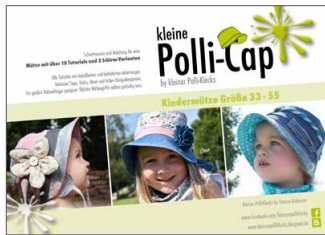
kleine Polli-Cap Sonnenhut • Größe 33-55