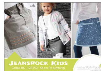
Jeansrock Kids Jeansrock • Größe 86 - 128