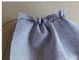
Einreihen/Raffen Seite 37