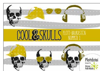
Plotterdateien „cool Skulls“ Cooles und Totenköpfe