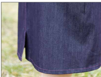
Gehschlitz Seite 33 - 36