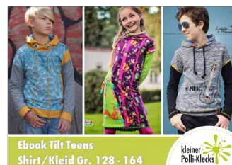
Tilt Teens Shirt/Kleid • Größe 128 - 164