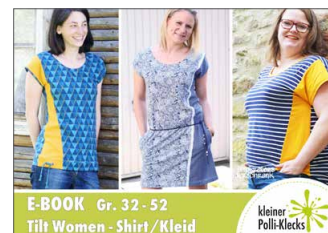
Tilt Damen Shirt/Kleid • Größe 34 - 52