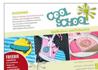
Plotterdateien „Cool School“ Rund um die coole Schule