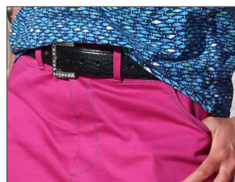
Gürtelschlaufen Seite 31