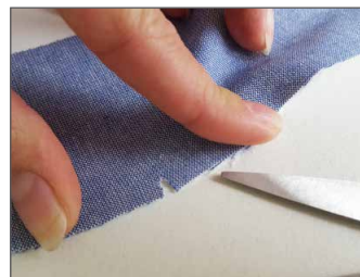
Knipse/Markierungen Seite 38