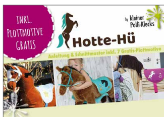
Hotte-Hü Pferddecke Für alle Spielperle