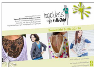
backless Shirt Fledermausshirt • Größe 32-54