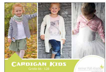
Cardigan Kids Jacke/Mantel • Größe 86 - 128