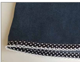
Saum mit Schrägband Seite 26 - 27