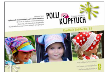
Polli-Kopftuch Kopftuch • Größe 33-55