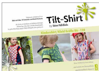
Tilt Kids Shirt/Kleid • Größe 86 - 128