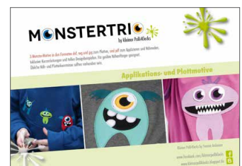
Plotterdateien „Monstertrio“ 3 Monsterfreunde