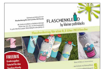
Flaschenkleid für 0,5 PET-Flaschen