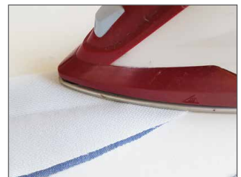
Verstärkung/Bügelvlies Seite 39