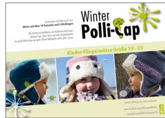
kleine Winter Polli-Cap Fliegermütze • Größe 33-55