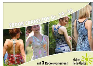
Caress Top/Kleid Sport/Freizeit • Größe 34 - 46