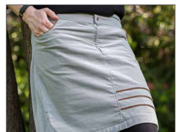
vordere, einseitige Biesen Seite 32