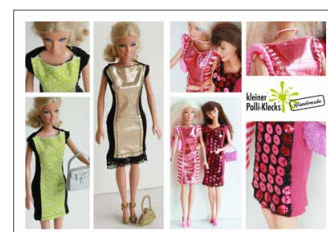
Puppenkleidung für die „schmalen Damen“